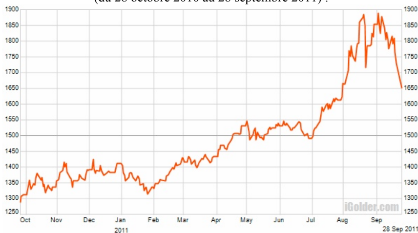
Évolution du cours de l'once d'or en $ depuis 1 an (du 28 octobre 2010 au 28 septembre 2011) :