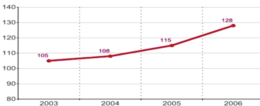
Montants investis en recherche, développement et ingénierie en millions d'euros